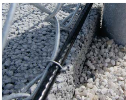
Câble acier gainé 6mm partie basse