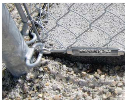
Tendeur à lanterne en inox