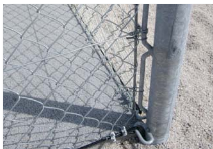
Poteau d'angle avec barre de maintien soudée.