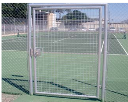
Porte tennis 2 x 1,20 m