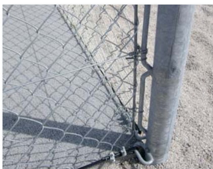
Poteau d'angle avec barre de maintien soudée.