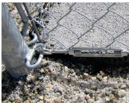
Tendeur à lanterne en inox