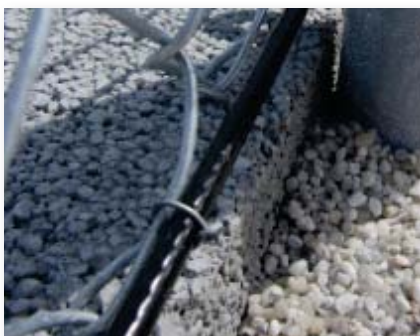
Câble acier gainé 6mm partie basse